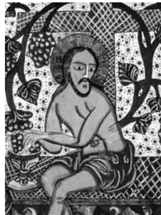
Bild: Christus im Weinstock, Hinterglas-Ikone, Rumänien

Jesus Christus spricht: Ich bin der Weinstock, ihr seid die Reben. Wer in mir bleibt und ich in ihm, der bringt viel Frucht. Denn ohne mich könnt ihr nichts tun! Joh 15,5